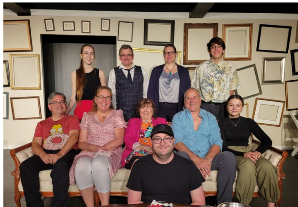
À l'avant, de gauche à droite