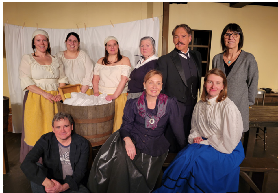
Rangée du bas, de gauche à droite